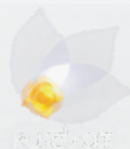
Kurdsat Broadcasting Corporation